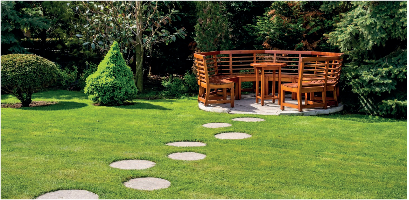
Stand: Mai 2019

Die Düngemittelhersteller verwenden für die Düngerangabe in der Regel Prozentwerte. Diese müssen auf g/m 2 umgerechnet werden.